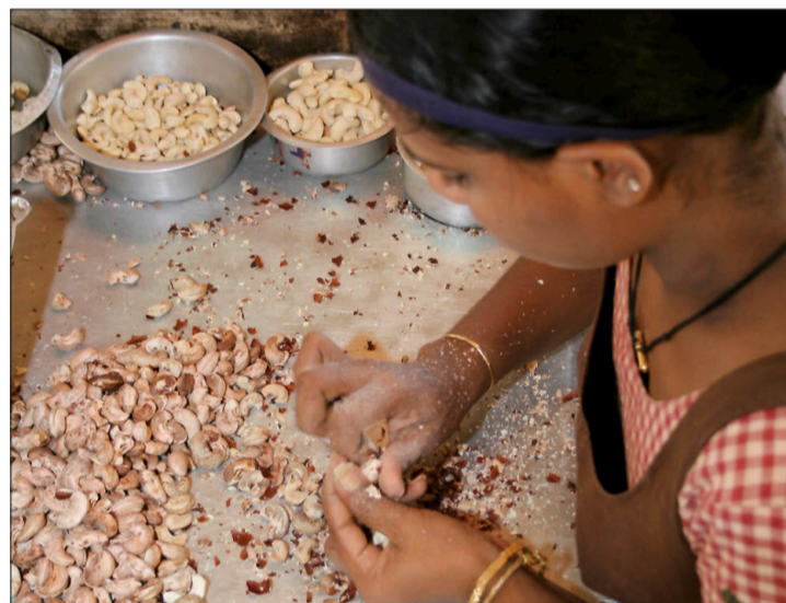
Die Haut wird mit dem Messer entfernt.

Alliance Kerala» trocknen und tragen sie dann sackweise auf den Schultern oder auf dem Kopf zu einem der Sammelplätze. Dort werden die Früchte des Cashewbaums kontrolliert und gewogen, und die Bauern erhalten ihr Geld bar auf die Hand.