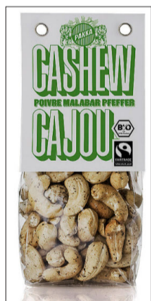
Mit Pfeffer (l.) und Meersalz (r.), Sortiment im Barständer.