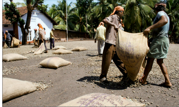
Die Nüsse werden am Sammelplatz zum Trocknen ausgelegt.