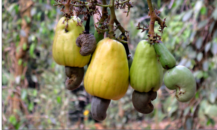
Unter jedem Cashew-Äpfel hängt nur eine einzelne Nuss.

Dieses Ziel hat auch die Organisation «Fair Trade Alliance Kerala», in der sich mittlerweile 3500 biologisch produzierende Kleinbauern zusammenges-