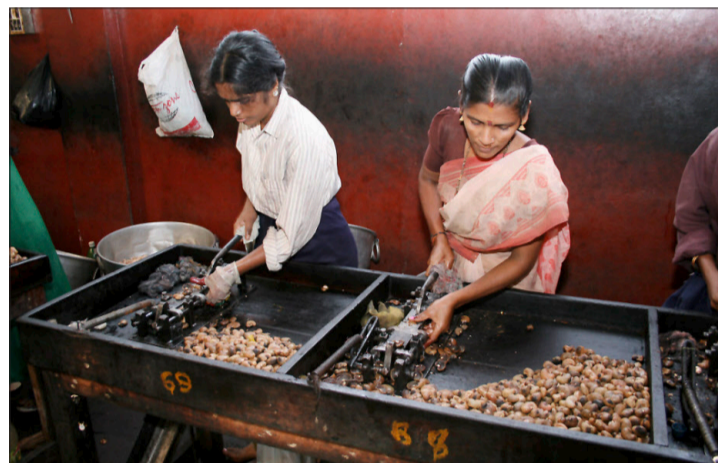
Geknackt werden die Roh-Cashews in Handarbeit.