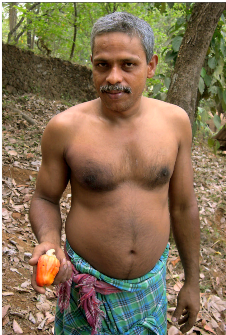
Bauern sammeln die reifen Früchte ihrer Bäume.